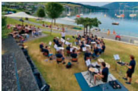
Badi Immensee 2023

Ende August statt. Die Daten und bereits bekannte Angaben sind auf der Titelseite aufgeführt. Weitere Infos publizieren wir rechtzeitig auf unserer Homepage und Online-Kanälen.